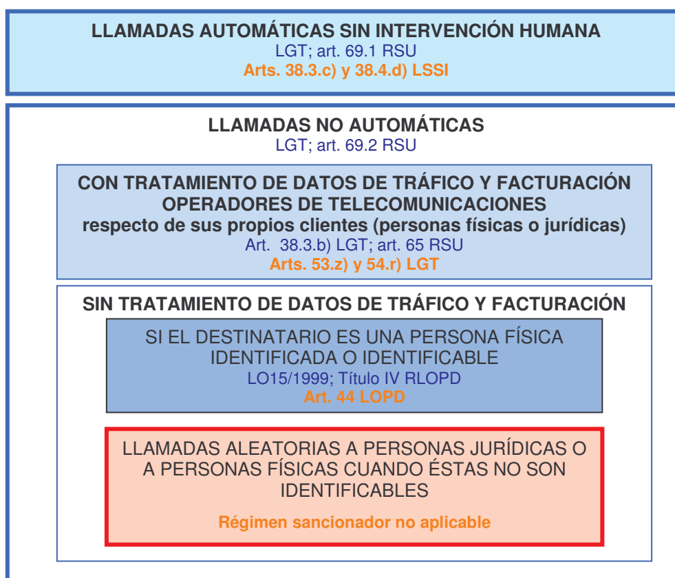
Fig.1 Normativa y régimen sancionador aplicable por la AEPD según la modalidad de llamada